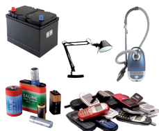
Piles, petits objets ménagers électriques ou électroniques