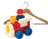
Les petits objets cassés