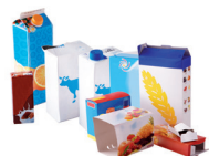
Les emballages et briques en carton