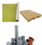
Rebuts de bricolage