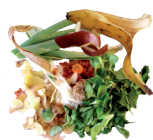
Épluchures, fruits & légumes gâtés