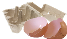
Coquilles & boîtes d'œufs (écrasées et en morceaux)