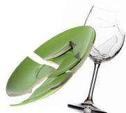
Les débris de vaisselle