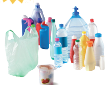
Les emballages en plastique