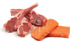
Déchets de viandes et poissons crus