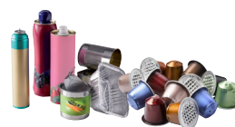
Les emballages en métal, même les petits