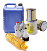
Huiles alimentaires, peintures et produits toxiques