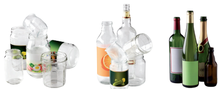
Bouteilles, pots, bocaux

En vrac, sans bouchon ni capsule ou couvercle. Uniquement entre 8h et 21h.